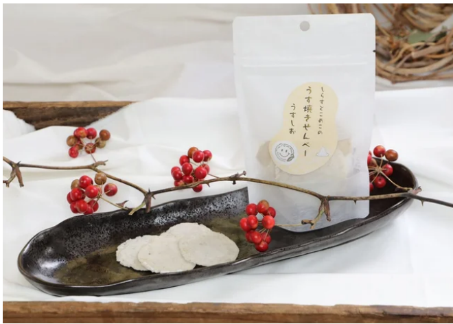
大阪産しらすと米粉を使用したうす焼きせんべい