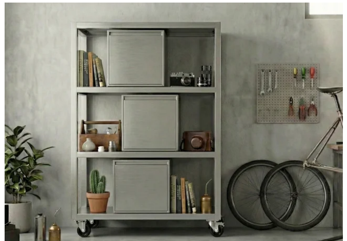
精度と美しさが融合した金属キャビネット