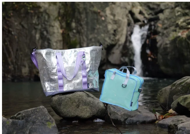
サ活に届け！本気のサウナバッグ