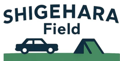
旧車の「部品がない」を解決するオンライン広場