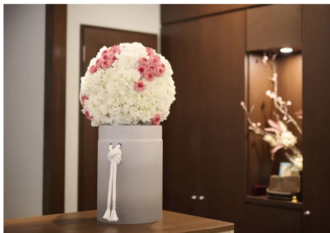
紙製とは思えない上質な質感の植物用ポット