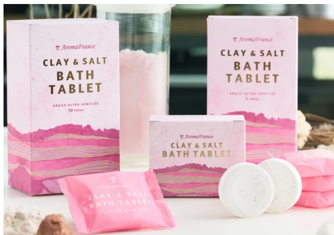
フランス産クレイ&ソルト バスタブレット