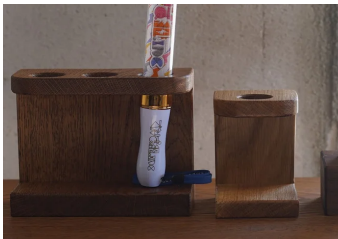
「大切なもの」の居場所