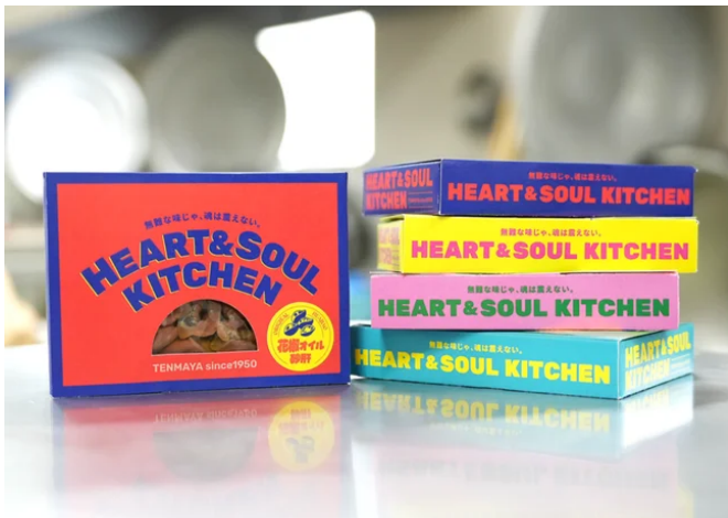
魂が震える 旨辛おつまみ食堂