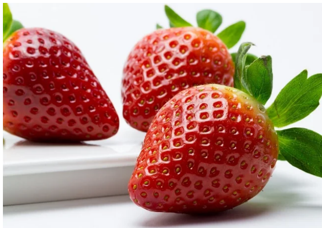
微生物が育てる無農薬・無堆肥の完熟いちご