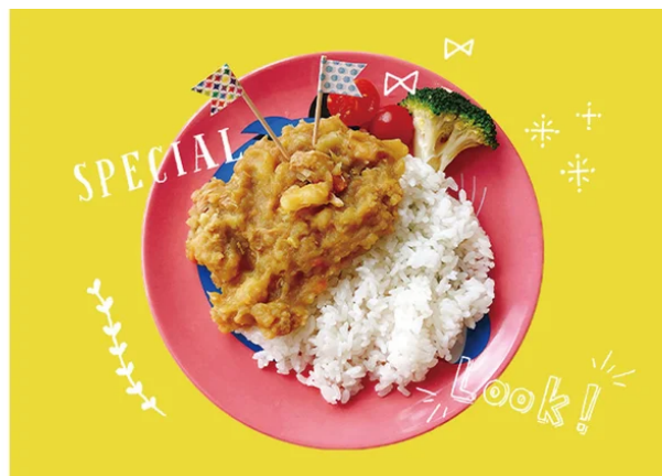
かくれんぼ野菜のkidsカレー | 親子カフェ ラフアラフ