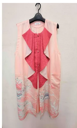
針しごと工房そら | 有恒産業株式会社