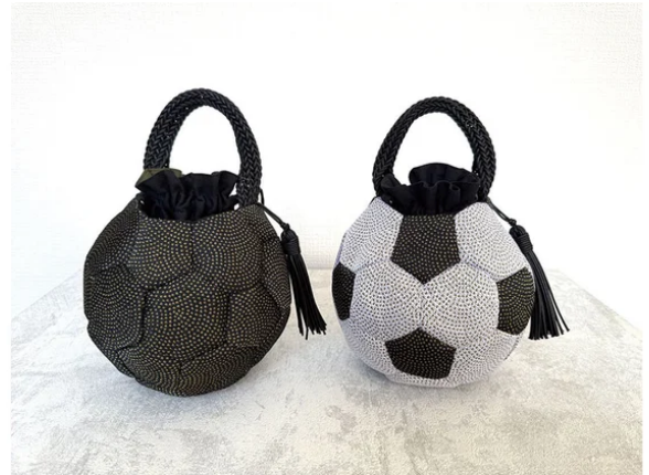
HASHICO | 合同会社HASHICO