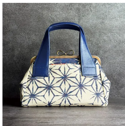
BE | サンアイ