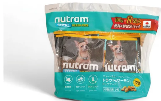
Nutram | 株式会社CLOCK