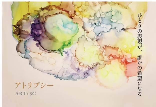
アトリプシー／ART+3C | さつきデザイン事務所