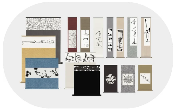
禅語のお軸 | 株式会社清華堂