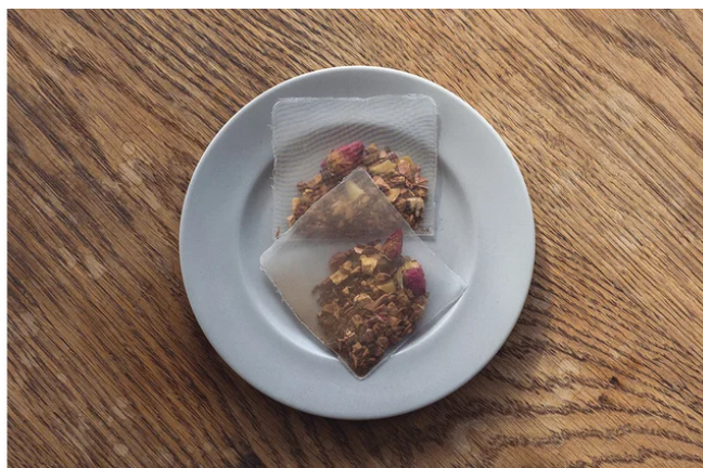
茶仁颯燕 | 株式会社スピッカート