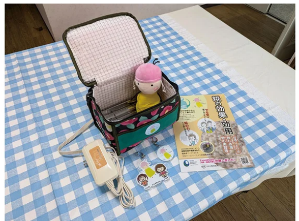
米糴発酵器 | SKH株式会社