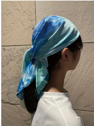
Mujimo Art Products | Mujimo株式会社