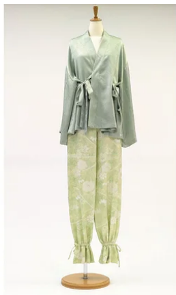
enasak ori | 株式会社Ki