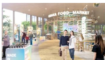
⑥ミライの大阪の食・文化