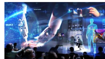
ミライのエンターテインメントバーチャルパビリオン