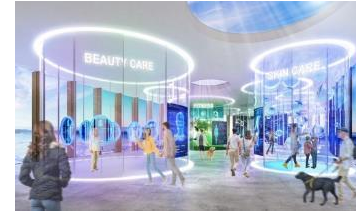
③ミライのヘルスケア体験