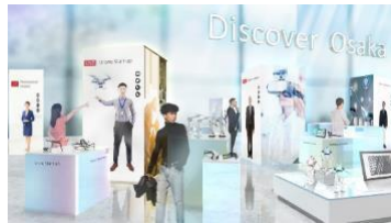
⑤展示・出展ゾーン