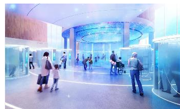
①ミライへのゲート・ライド