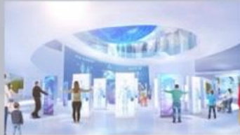
まち中のスキャンマシン