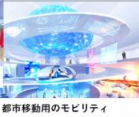
都市移動用のモビリティ