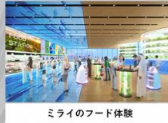
ミライのフード体験