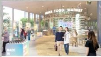
ミライの大阪の食・文化