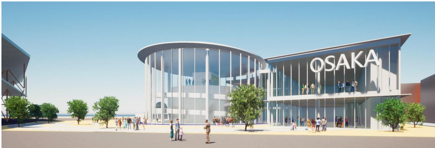
大阪パビリオン外観検討パース（建築基本設計を進めており、外観は大きく変更される予定です）