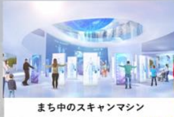
まち中のスキャンマシン