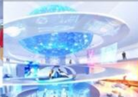
都市移動用のモビリティ