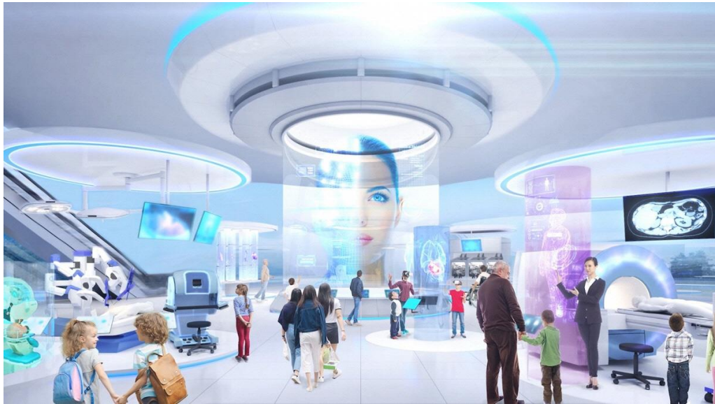
先進的な医療技術やサービスを体験 再生医療や遺伝子治療などの成果などを展示 来館者が近未来の病院を体験できる参加型展示