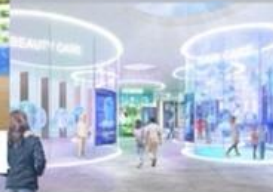
ミライのヘルスケア体験