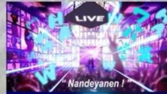
ミライのエンターテインメント