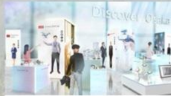
ミライに向けた中小企業・ スタートアップの技術・サービス