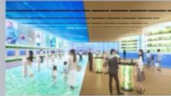
ミライのフード体験