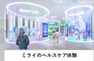
ミライのヘルスケア体験