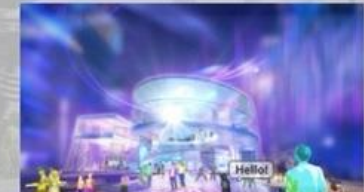
バーチャルパビリオン