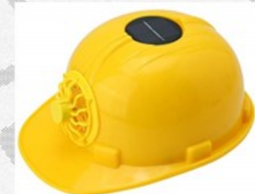
冷却機能ヘルメット