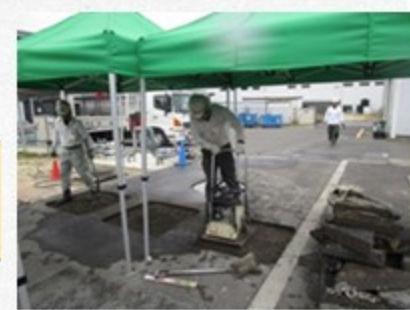
組立式簡易テント