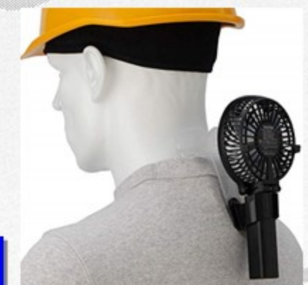
ヘッドタオル付 携帯扇風機