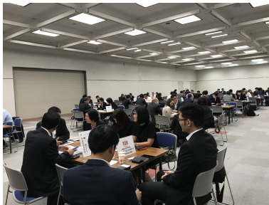
お申込み等は、お問合せ先へ直接ご連絡ください。