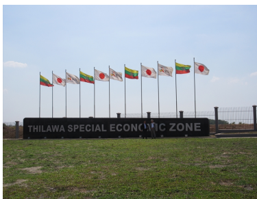
お申込み等は、お問合せ先へ直接ご連絡ください。