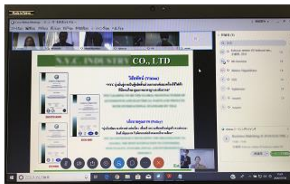
参加企業はプレゼン機能を利用して、自社説明を行いました