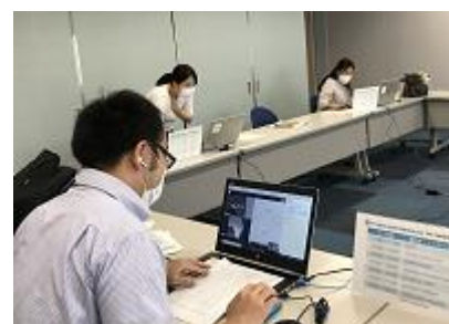
商談時間中の事務局会場。事務局は画面の外から、参加企業の商談をサポートしました